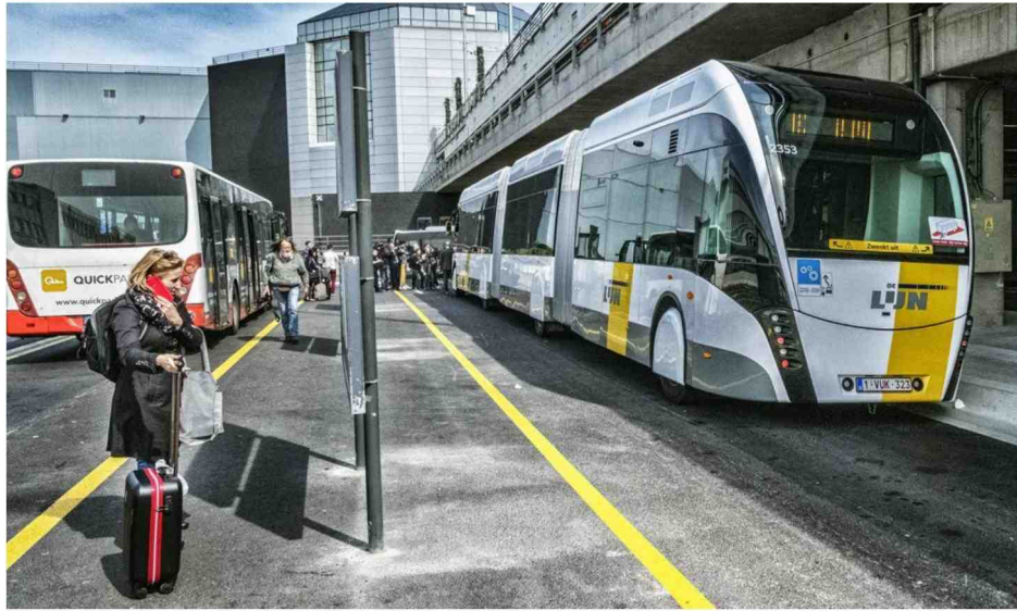
Op de ringlijn rond Brussel worden vandaag al trambussen ingezet (hier aan de luchthaven van Zaventem).

Doorbraak in het Spartacusplan: de trambus Hasselt-Genk-Maasmechelen zal over de grote ring in Hasselt lopen. Voor de lijn Hasselt-Maastricht moet een nieuwe studie de knoop tram/trambus doorhakken.